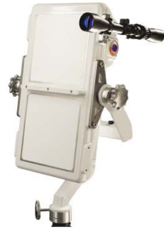
Radar Doppler BR-1001