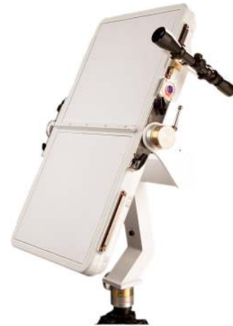
Radar Doppler BR-29015