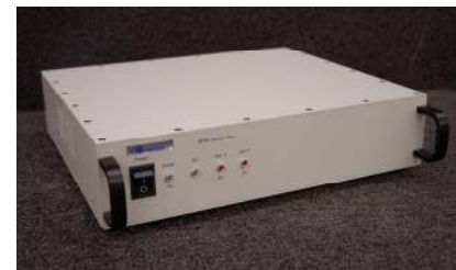
Boîte de Jonction JB-6e (acquisition de données)